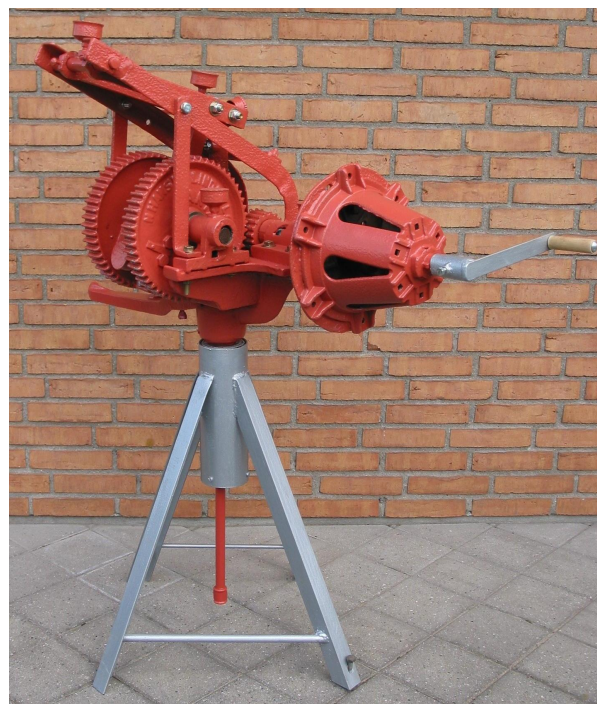
For at mølletoppen kan gøre rigtig gavn i DVS’ samling, har vi valgt at placere den på et stativ i passende højde, så man kan få lov både at se og dreje på håndsvinget. Mølletoppen kan ligeledes krøje på stativet.