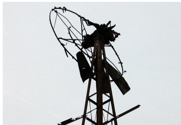
Ejeren har efterfølgende taget møllen ned og foræret os toppen og rotoren.