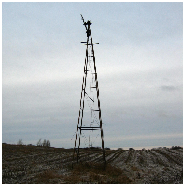
Møllen som den stod til sidst før nedtagning. Tårnet er ca. 13 m højt.

Vi er mest interesserede i de vitale dele – altså de bevægelige dele i mølletoppen m.m. og evt. rotoren.