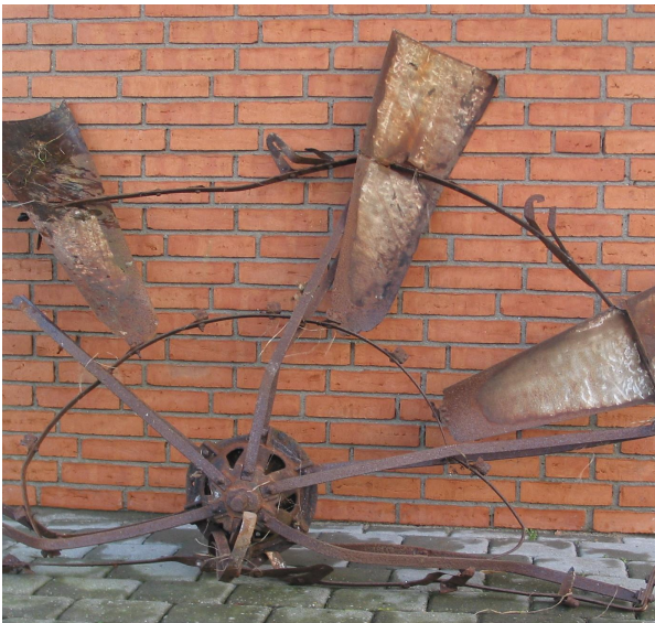
Rotoren efter nedtagning.

Navet er ”knækket” af ved nedtagningen. Vi har besluttet, at skære vingerne af og kun beholde navet.